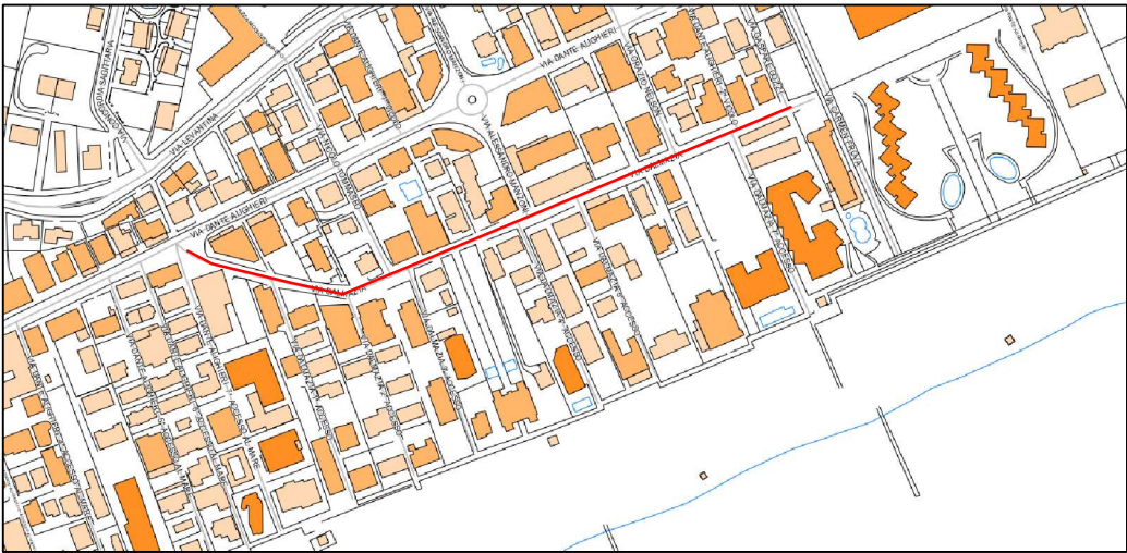
ESTRATTO DI C.T.R.

Il Comune di Jesolo ha un Sistema Qualità certificato in accordo alla norma UNI EN ISO 9002 per i seguenti uffici: Commercio, Tributi, Pianificazione e Attività Edilizia